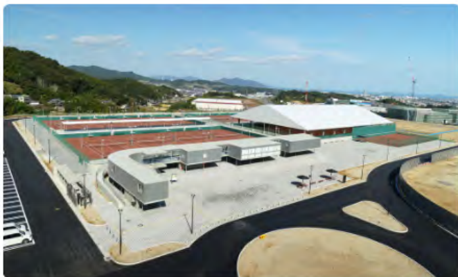
今治新都市スポーツパークテニス施設