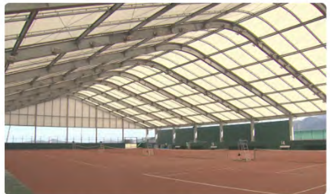
今治新都市スポーツパーク屋内テニスコート