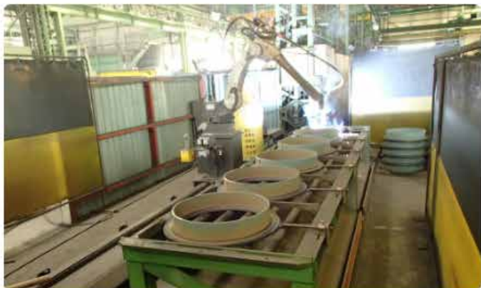
マンホール枠 ロボット溶接