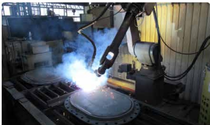
マンホールフタ ロボット溶接