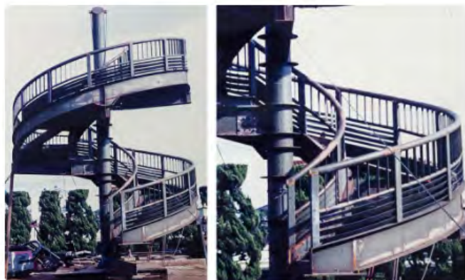
鹿ノ子池公園歩道橋螺旋階段