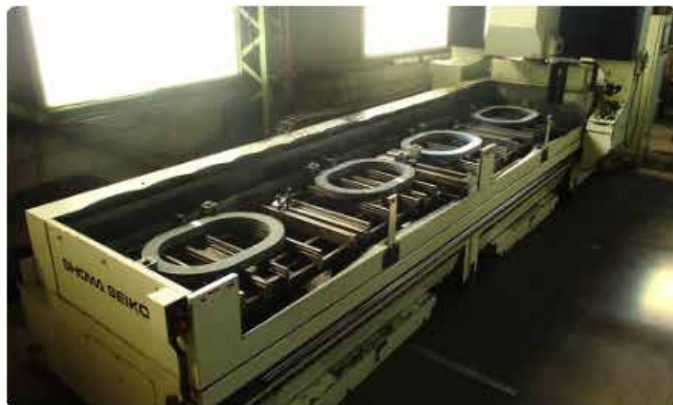
マンホール 自動穴明・タップ