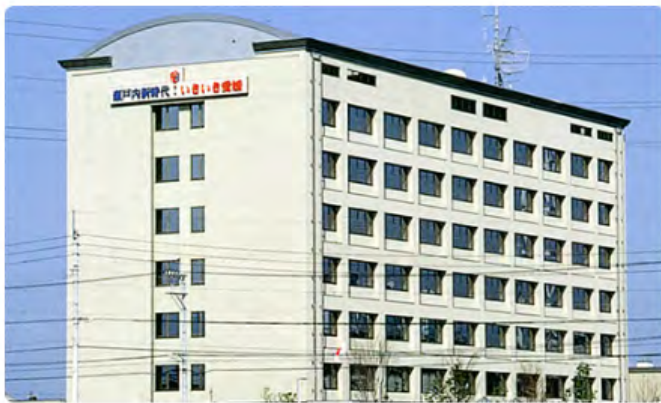
愛媛県西条地方局庁舎