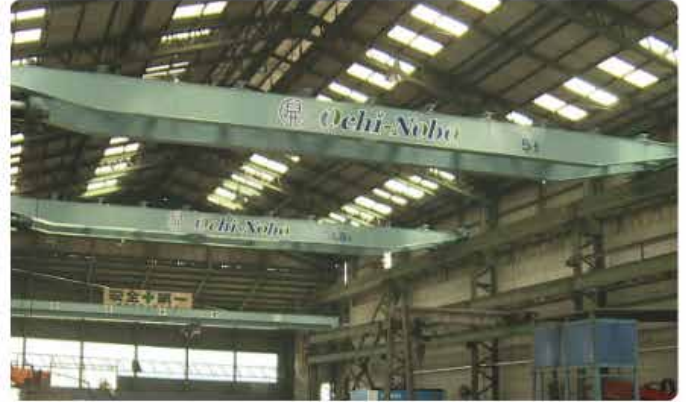
越智昇鉄工本社工場 天井クレーン