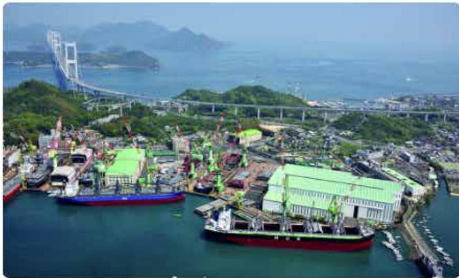
今治造船本社工場