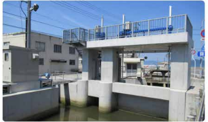
水門ローラーゲート