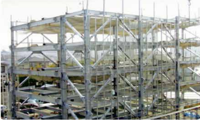
立体駐車場 (大阪市豊島区(建設中))