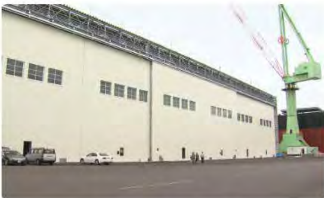
今治造船西条工場西塗装工場