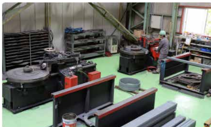
マンホール曲げ加工

船舶に使われるマンホール。ここでは、ムダのない独自の工法で鉄板を曲げ、スクラップ率を減少させるなど効率性、経済性を高めています。さらに、高度な産業用ロボットを導入し、作業の自動化も進めています。