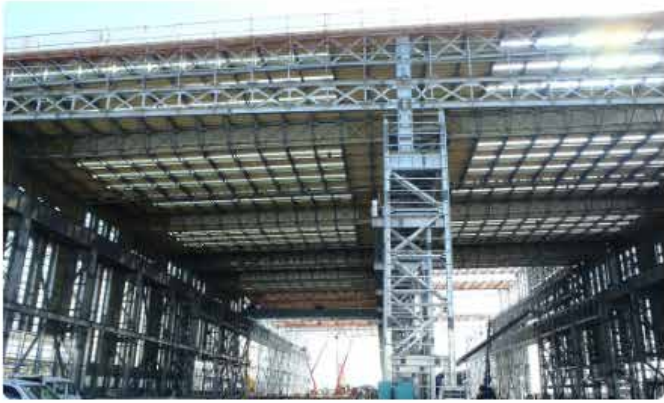
今治造船 丸亀南組立工場内部