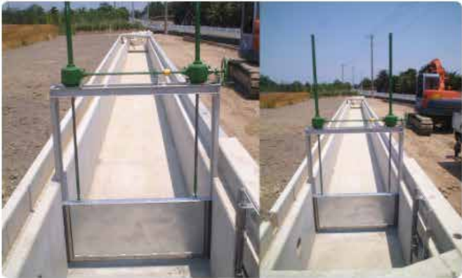
水門スライドゲート