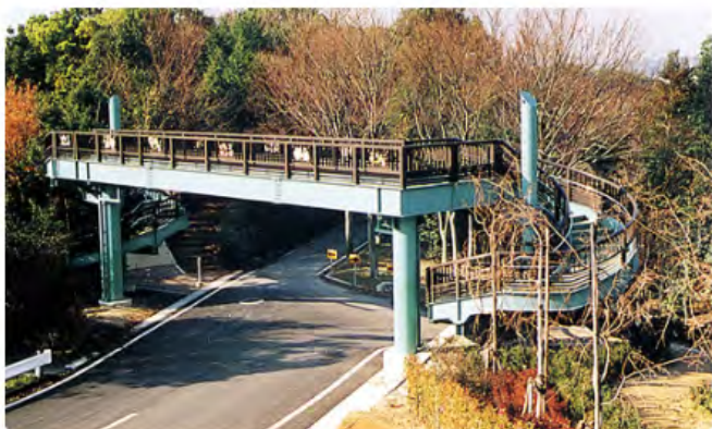
鹿ノ子池公園歩道橋