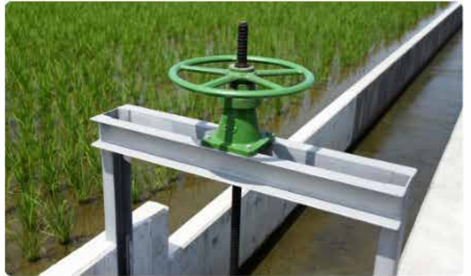
スライドゲート開閉装置