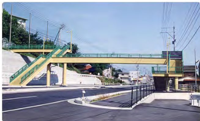
近見小学校前歩道橋