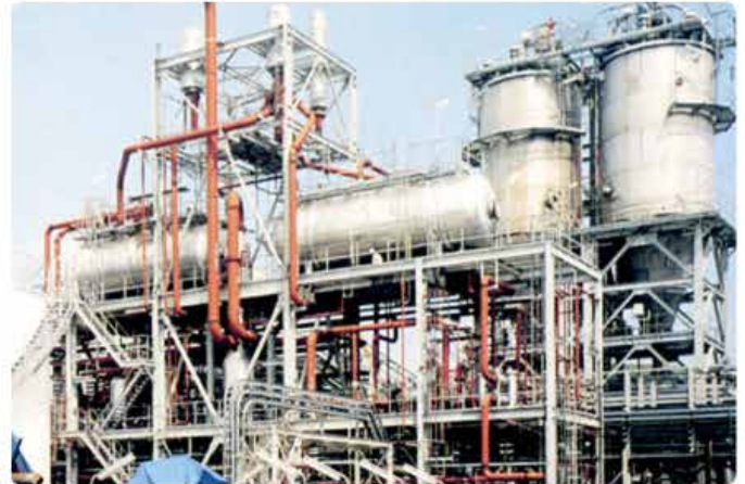
インドネシア火力プラント