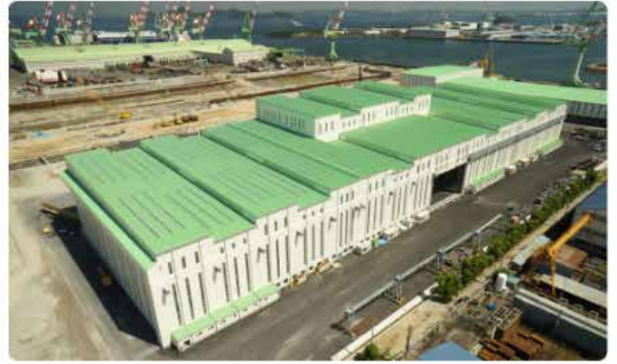
今治造船 丸亀南組立工場