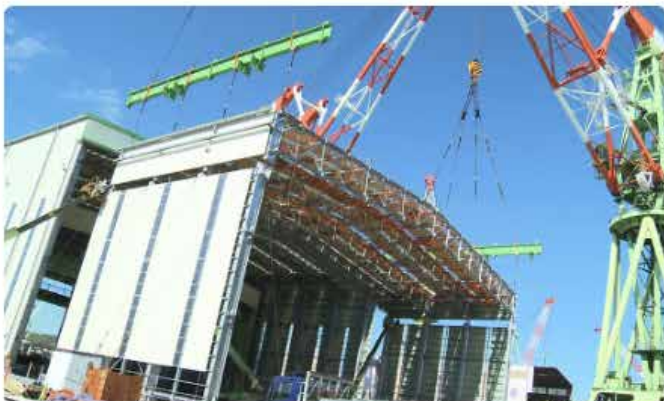
今治造船本社工場 移動建屋 建設中