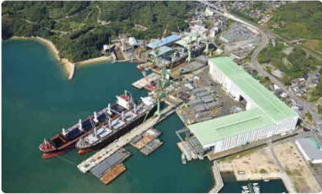
しまなみ造船株式会社工場