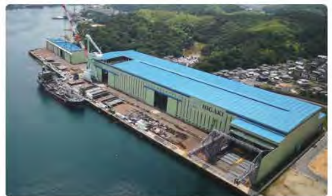
檜垣造船波方工場