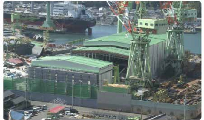
今治造船本社工場 移動建屋