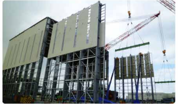
今治造船西条東ひうち工場 移動建屋 建設中